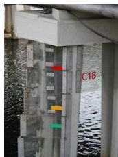
Značky na mostním pilíři