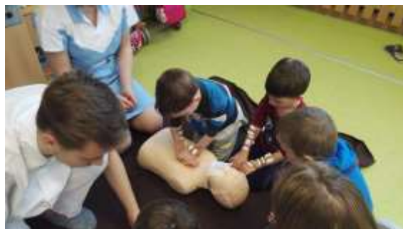
Nácvik první pomoci v MŠ