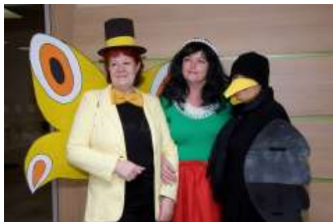
Dětský karneval s motylem Emanuelem a Makovou panenkou