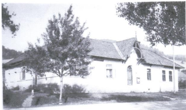
Obecní dům z roku 1905

O historii obecního úřadu v Olšanech se dočteme v obecní kronice: