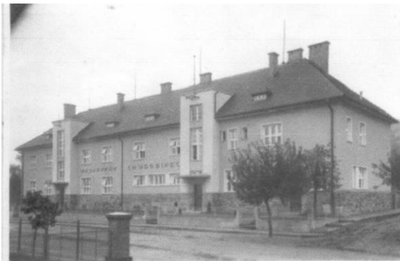
Novostavba Masarykova obecního domu a chudobince

V Masarykově chudobinci jest kromě křídla pro chudobinec též mateřská škola Ústř. mat. školské, byt pro učitelku, lázně, místnost obecní správy, kancelář a zasedací síň obecního zastupitelstva, obecní čítárna a knihovna, místnosti pro Spořitelni a záložní spolek v Olšanech, poradna matek.“