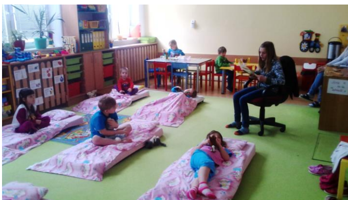
Školáci chodí každý čtvrtek čist dětem do MŠ

Školení se uskuteční v úterý 26. dubna 2016 od 15:00 do 18:00 hodin. Vstup zdarma.