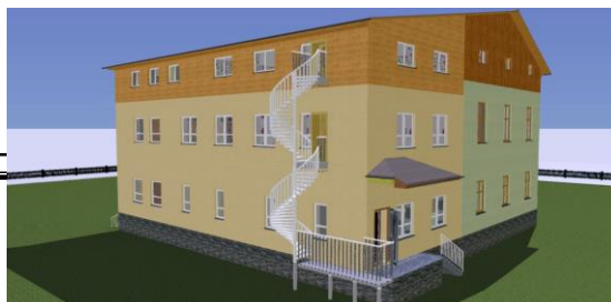
Pohled na přístavbu nové mateřské školky ke škole